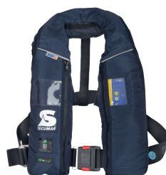
Alpha 275 AS Solas (Référence produit 14824-01)