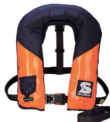
Golf 275 AS (Référence produit 13805)

Compatible pour une utilisation avec les modèles de dispositifs de flottaison personnel Secumar suivants :